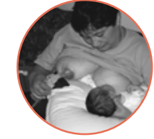
Pamu e alu i le eletise