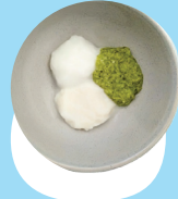
Oku momosi fakataha mo e piisi pea mo e pateta