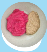
Konga puaka 'oku momosi fakataha mo e piitiluti pea