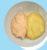
Mara konga puaka 'oku momosi fakataha mo e 'apele pea moe kumala