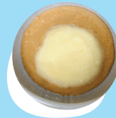
Pisikete ngaohi me i he uite 'oku o'i fakataha mo e 'apele kuo momosi