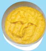
Fo'i moa 'o o'i fakataha mo e 'avoka pea mo hina