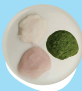
Konga moa, momosi fakataha mo e sipanisi pea mo e talo