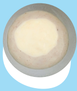
Polisi pe iokati mo e fua'akau piisi

Kamata'aki hano fafanga tu'o taha he 'aho hili 'a e fakahuhu pe fakainu hina hu'akau.