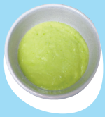
Moa 'oku momosi fakataha mo e polokolii pea mo e pateta