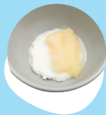
Laise 'a e longa'i pepe pea mo e fainā kuo 'osi momosi