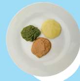
Konga pulu 'oku kale'i 'o momosi fakataha mo e piini pea mo e kumala

Ngaue'aki 'a e hu'akau me i he hu'a huhu 'o e fa'e pe ko e efuefu'i hu'akau 'a e longa'i pepe ke fetongi'aki 'a e hu'akau pulu ka e 'oleva kuo ta'u taha 'a e leka.