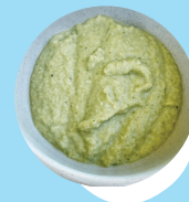
Ikeika'avai, fakataha mo e sipanisi pea mo e supo kumala