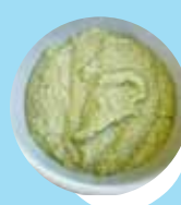
Ikeika'avai, fakataha mo e sipanisi pea mo e supo kumala