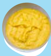
Fo'i moa 'o o'i fakataha mo e 'avoka pea mo hina