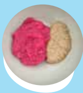
Konga puaka 'oku momosi fakataha mo e piitiluti pea