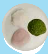
Konga moa, momosi fakataha mo e sipanisi pea mo e talo