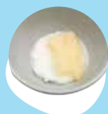
Laise 'a e longa'i pepe pea mo e fainā kuo 'osi momosi