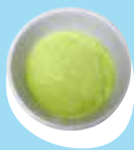
Moa 'oku momosi fakataha mo e polokolii pea mo e pateta