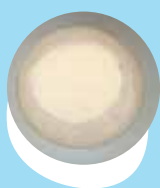
Polisi pe iokati mo e fua'i'akau piisi

Kamata'aki hano fafanga tu'o taha he 'aho hili 'a e fakahuhu pe fakainu hina hu'akau.