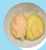
Mara konga puaka 'oku momosi fakataha mo e 'apele pea moe kumala