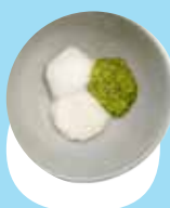
Oku momosi fakataha mo e piisi pea mo e pateta