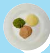
Konga pulu 'oku kale'i 'o momosi fakataha mo e piini pea mo e kumala

Ngaue'aki 'a e hu'akau me i he hu'a huhu 'o e fa'e pe ko e efuefu'i hu'akau 'a e longa'i pepe ke fetongi'aki 'a e hu'akau pulu ka e 'oleva kuo ta'u taha 'a e leka.