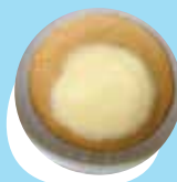
Pisikete ngaohi me i he uite 'oku o'i fakataha mo e 'apele kuo momosi